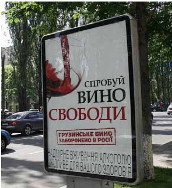
Abbildung 1: »Probier den Wein der Freiheit. Georgischer Wein ist in Russland verboten.« Werbeplakat in Kiew

anderem bei der Demilitarisierung der Schwarzmeer-Region zusammenarbeiten und für eine Weiterentwicklung der GUAM (1997 gegründeter Zusammenschluss von Georgien, der Ukraine, Aserbaidschan und Moldova) sorgen.