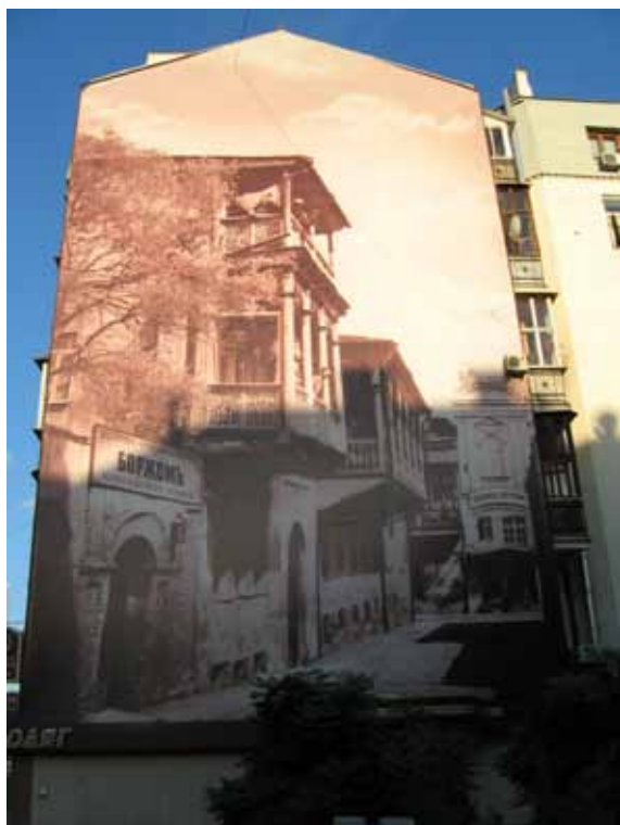
Abbildung 4: Hauswand hinter dem Schota Rustaweli-Denkmal in Kiew, Foto: Jenny Alwart, 9/2010.

Minister statt. Eine ähnlich enge Beziehung, wie jene zwischen Saakaschwili und Juschtschenko, die sogar noch eine symbolische familiäre Dimension bekam, als Juschtschenko Taufpate eines Saakaschwili-Sohnes wurde, besteht im Moment nicht.