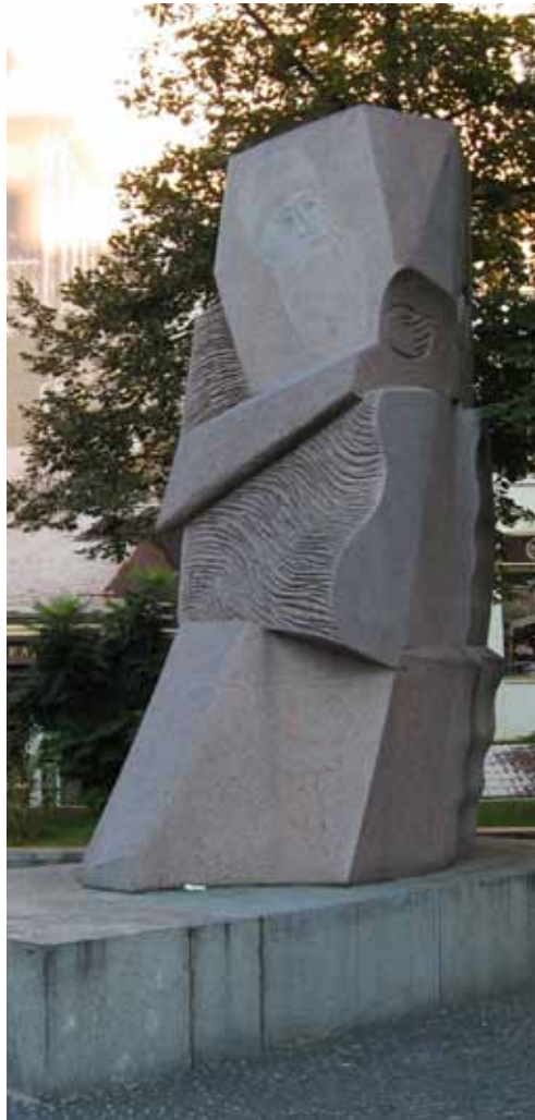
Abbildung 3: Schota Rustaweli-Denkmal in Kiew, Foto: Jenny Alwart, 9/2010.

So sagte Saakaschwili im Oktober 2011: »Nie war das Verhältnis zwischen unseren Völkern besser als jetzt.« Und Janukowytsch verlieh in einem Grußwort zum Unabhängigkeitstag Georgiens im Jahr 2010 seiner Überzeugung Ausdruck, dass sich die »traditionell warmen und freundschaftlichen ukrainisch-georgischen Beziehungen auch weiterhin vertiefen und zum Wohl der Völker der Ukraine und Georgiens entwickeln werden«. Tatsächlich aber finden Treffen derzeit nicht zwischen den Präsidenten, sondern auf der Ebene der