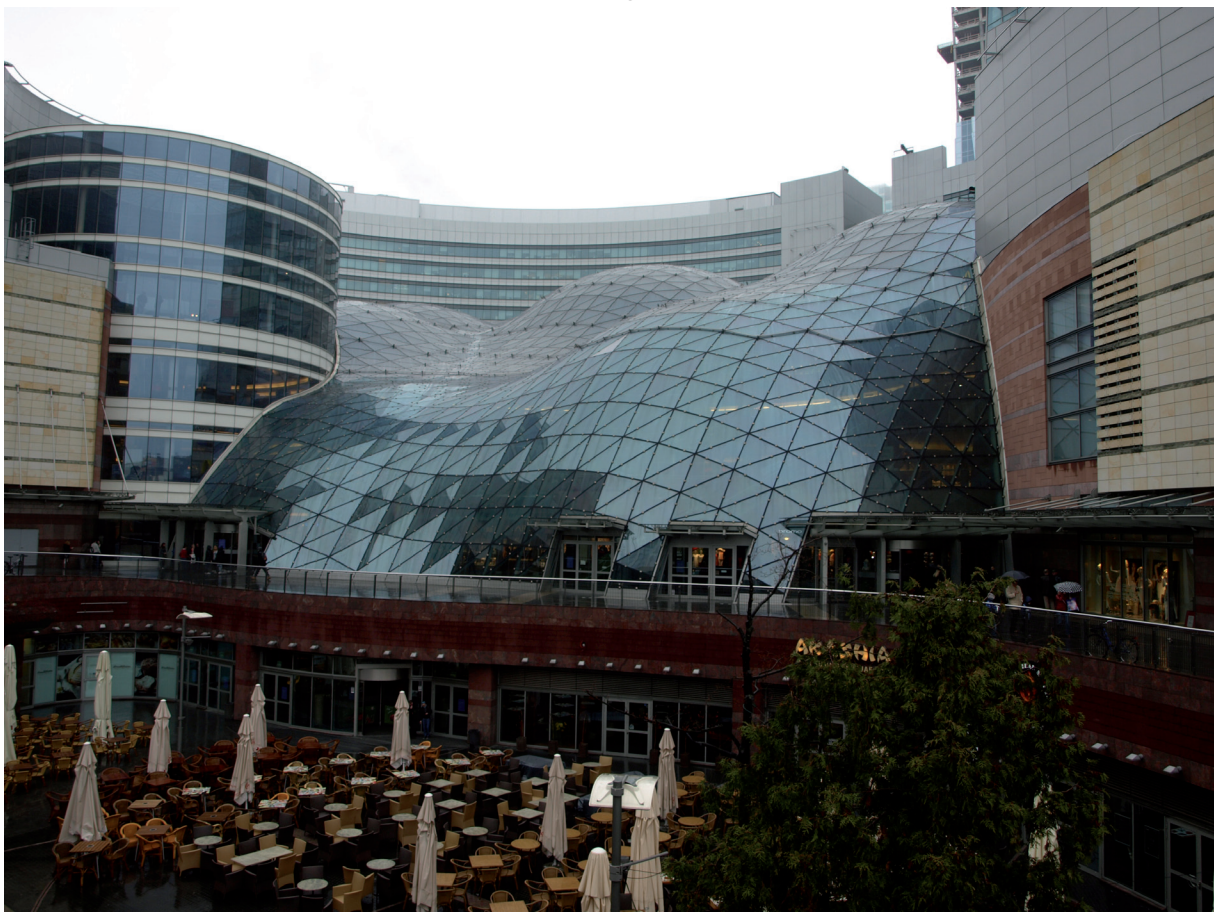
Abbildung 5: Die Shoppingmall »Złoty Terasy« (Goldene Terrassen), 2007 eröffnet, mit rund 65.000 m 2 Verkaufsfläche, Investor: die niederländische ING real group

Im Kontext der Systemtransformation vollzog sich in der Stadtlandschaft Warschau der Übergang vom Leitbild der »sozialistischen Stadt« als »Große Erzählung« zu einer an »Nicht-Planung« grenzenden Eigenentwicklung der vielen »Kleinen Erzählungen«. Dabei vollzieht sich die Entwicklung im Wesentlichen auf Grundlage der Logik der global organisierten Ökonomie, die